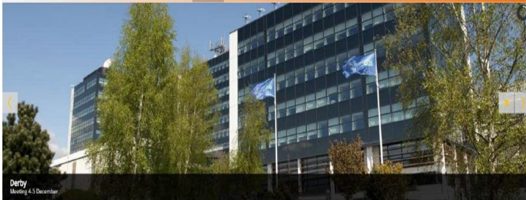
Derby Meeting 4-5 December