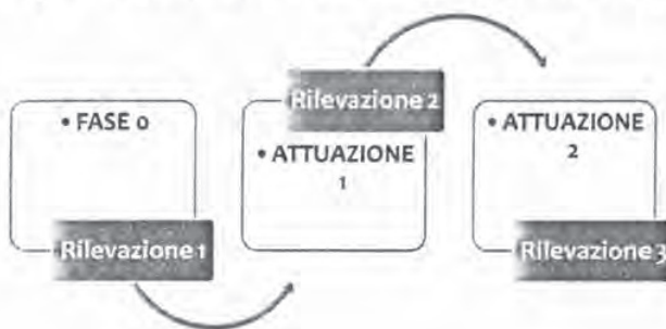
Figura 1 Il percorso di ricerca del programma P.I.P.P.I.

Nella fase 3 del programma, le singole EEMM sostenute dai coach e dal GS, sono chiamate a raccogliere i dati emersi dal lavoro con ogni singola famiglia e puntualmente registrati attraverso gli strumenti messi a disposizione per redigere un sintetico rapporto di ricerca complessivo sull'andamento delle 10 famiglie target incluse nel programma, da consegnare al Ministero entro giugno 2015, per poter accedere all'erogazione del saldo del finanziamento.